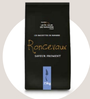
Les Baguettes de Navarre

Su miga alveolada color crema natural y su potente sabor atraerá a los gourmets más exigentes.