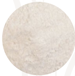
Harina de trigo sarraceno