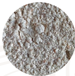
Harina de espelta integral