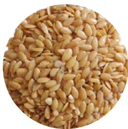
Semillas Lino Dorado