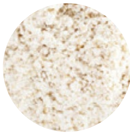
Harina de avena