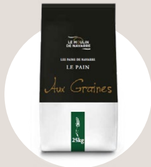
Les pains de Navarre

Pan de intenso sabor, su miga salvaje y crujiente corteza te transporta al corazón de los valles pirenaicos.