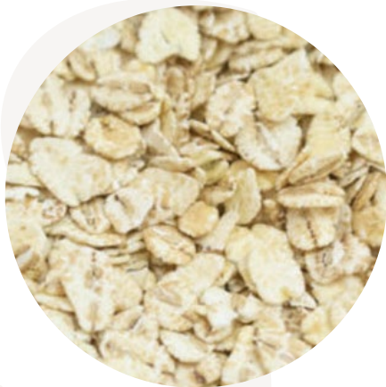
Copos de cebada