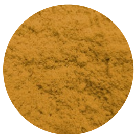
SELECTOST CORN H35 GAUDE