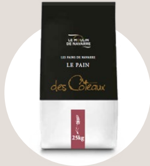
Les pains de Navarre