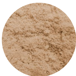
HARINA DE CEBADA MALTEADA ACTIVA