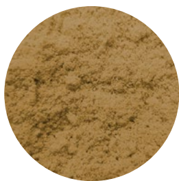
SELECTOST WHEAT H40