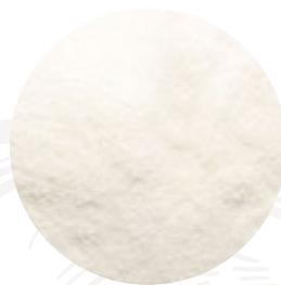
Harina de arroz