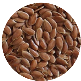
Semillas Lino Marrón