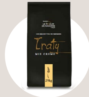
Les Baguettes de Navarre

Mezcla equilibrada de cereales y semillas con un excelente aporte de fibra y proteína.