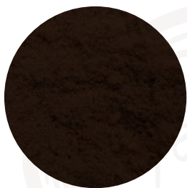
SELECTOST WHEAT H70