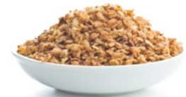
Cereales cortados tostados

Como toppings para darle un toque especial a tus panes