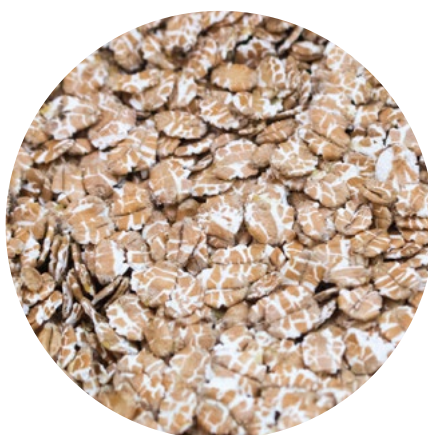
Copos de trigo