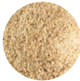
Harina de lino