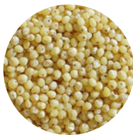
Semillas Mijo Amarillo