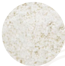
Harina de espelta