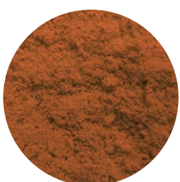
SELECTOST RED BARLEY