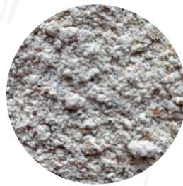
Harina de centeno integral