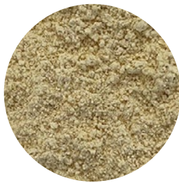
Harina de garbanzo