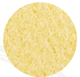
Harina de maíz amarillo