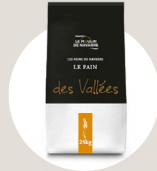
Les pains de Navarre

Un clásico francés, su equilibrada combinación de masas madre y harina de centeno permiten obtener migas alveoladas con sutiles notas de acidez.