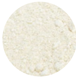
Harina de quinoa