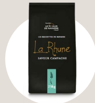
Les Baguettes de Navarre

Harina T65 que incorpora una intensa masa madre de trigo para la realización de panes con sabores suaves y equilibrados.