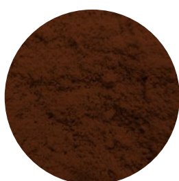
SELECTOST BARLEY H60