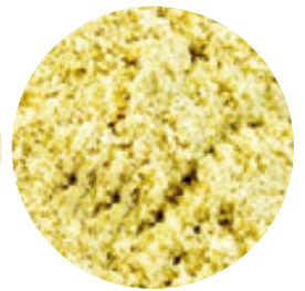
Harina de calabaza