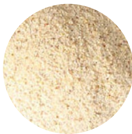
Harina de lentejas