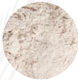
Harina de centeno