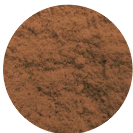
SELECTOST BARLEY H35