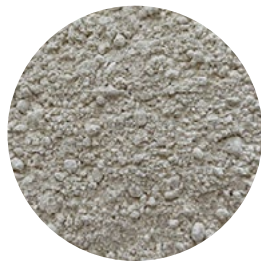
Harina de haba