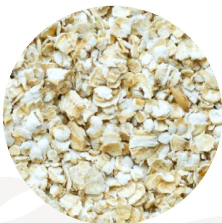
Copos de avena