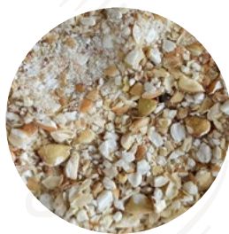
Trigo Sarraceno troceado