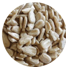
Semillas Girasol Peladas