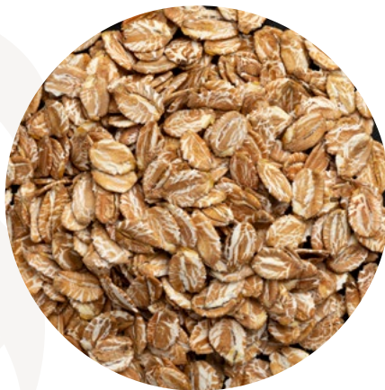
Copos de centeno