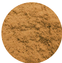
SELECTOST BARLEY H40