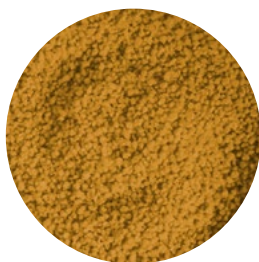
SELECTOST CORN S35 SÉMOLA